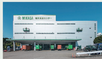
磐田物流センター