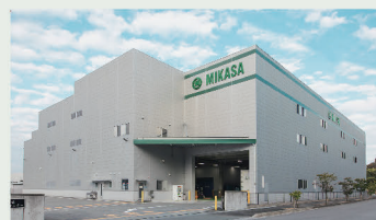
栄川第2物流センター