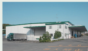
栄川物流センター