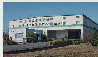
掛川物流センター